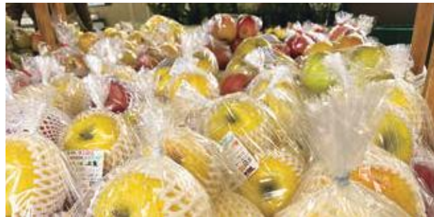
色とりどりの美味しいりんごが並ぶ

なんといっても相馬地区はリンゴ産地であることから、直売所会員にリンゴ生産者が多く、とても美味しいと感想をもらう事が多く、全国の知人へ送ったり、近隣の県からも買い求めに来るお客様が多かったです。