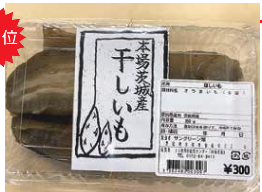
大人気商品の茨城県産干し芋

毎年12月後半から2月3月くらいまで店頭で並びますので是非一度食べてみて下さい。