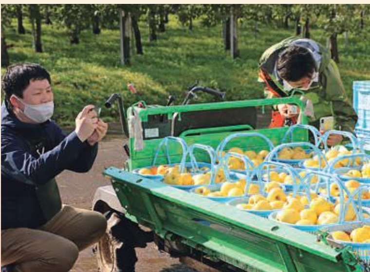
休憩中も映える写真を撮ることに一所懸命な参加者