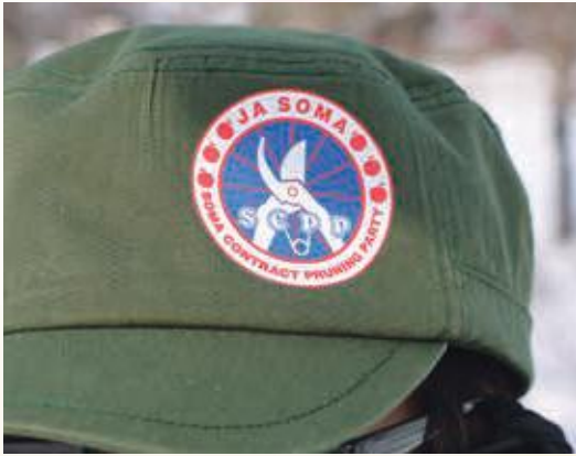
マークの中央には怪しい4文字