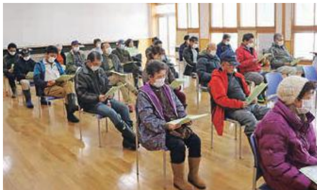
精算書を手に多くの生産者が訪れた