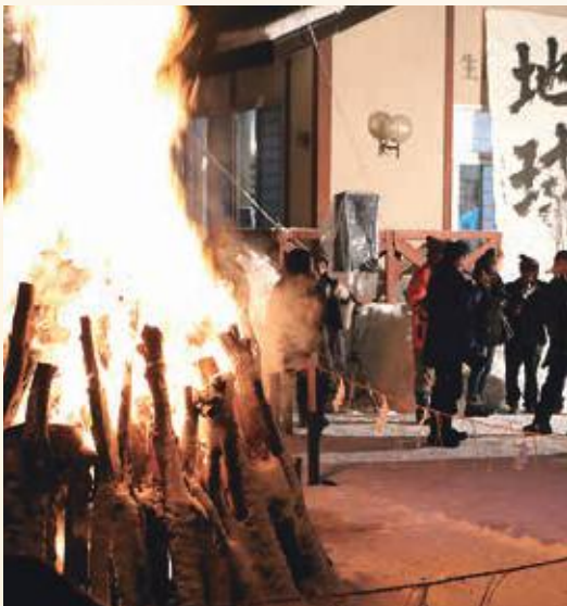
松明が激しく燃えるその後方には…