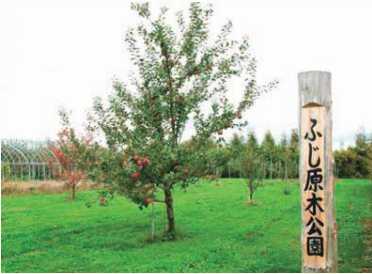
〇〇町にあるふじ原木公園