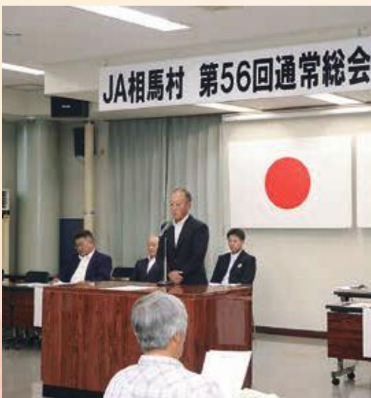
規模を縮小して行われた通常総会