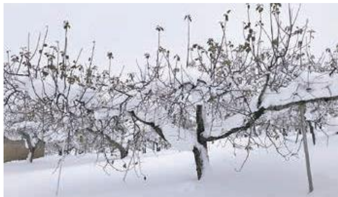
樹上にのしかかる大量の雪

管内7カ所を計測し、一番多い所で65cmの積雪を記録した。また、調査中に見えたりんごの樹上には20cmほどの積雪があったため、樹上の雪下ろしを早めに行うよう、生産者に声をかけていた。