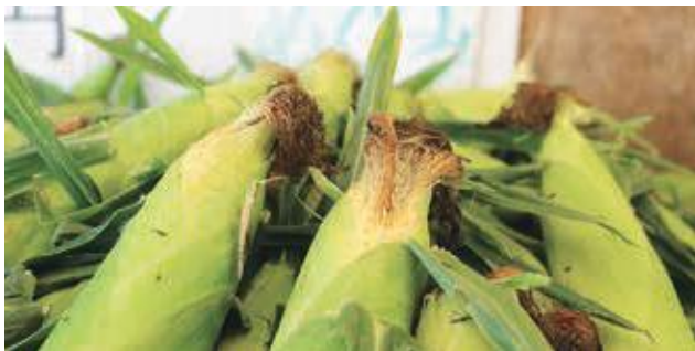
たっぷりと実が詰まった嶽きみ

夏野菜のメインともいわれる甘くて美味しい嶽きみ。こちらも全国への発送や他県からのお買い求めにくる消費者の方がとても多かったです。2021年産も楽しみにしています。