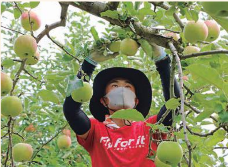
葉取作業に夢中な運行乗務員