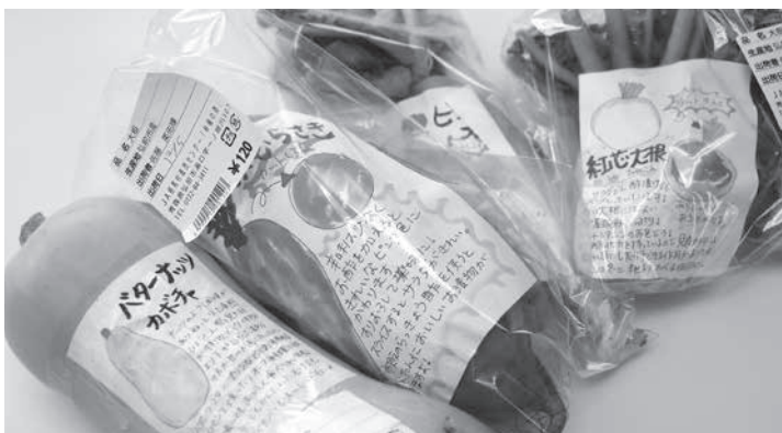
出荷者オリジナルの商品紹介が好評

やはり、ただ単に商品を出荷するだけではなく、その商品の魅力を消費者に伝えることも重要な鍵を握っています。直売所「林檎の森」では、棚に並ぶ野菜ごとに素材を活かした料理レシピを作成したりすることで好評を得ています。商品のPRやレシピ作成により、消費者の購買意欲を高めることが伺えます。直売所会員の皆さんも、積極的に挑戦してみたいかがでしょうか。小さなアイデアが大きな注目を集める鍵となります。